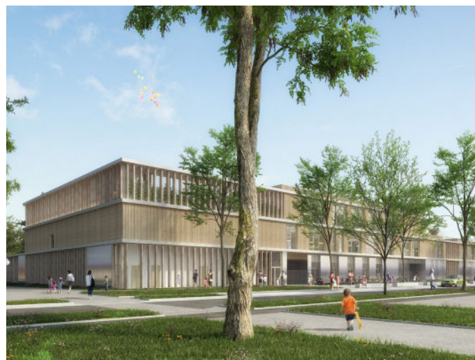
Perspective de la rue - Aubry lieutier architectes d.p.l.g.