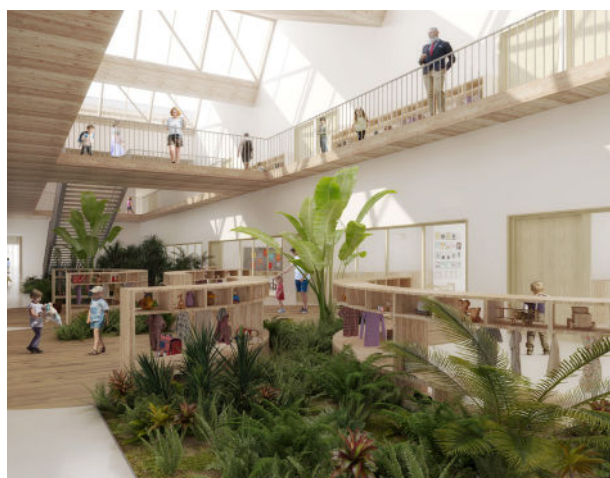
Perspective de l'intérieure - Aubry lieutier architectes d.p.l.g.