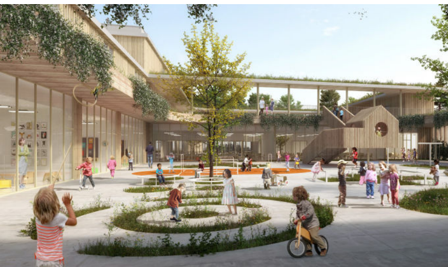
Perspective de la cour intérieure - Aubry lieutier architectes d.p.l.g.

Enfin, cette nouvelle école sera à la pointe de l'innovation car elle sera dotée d'équipements numériques modernes. Elle s'inscrit également dans le Programme de Réussite Éducative voulu par la municipalité et dont les actions portent déjà leurs fruits sur d'autres écoles classées en Réseau d'Éducation Prioritaire.