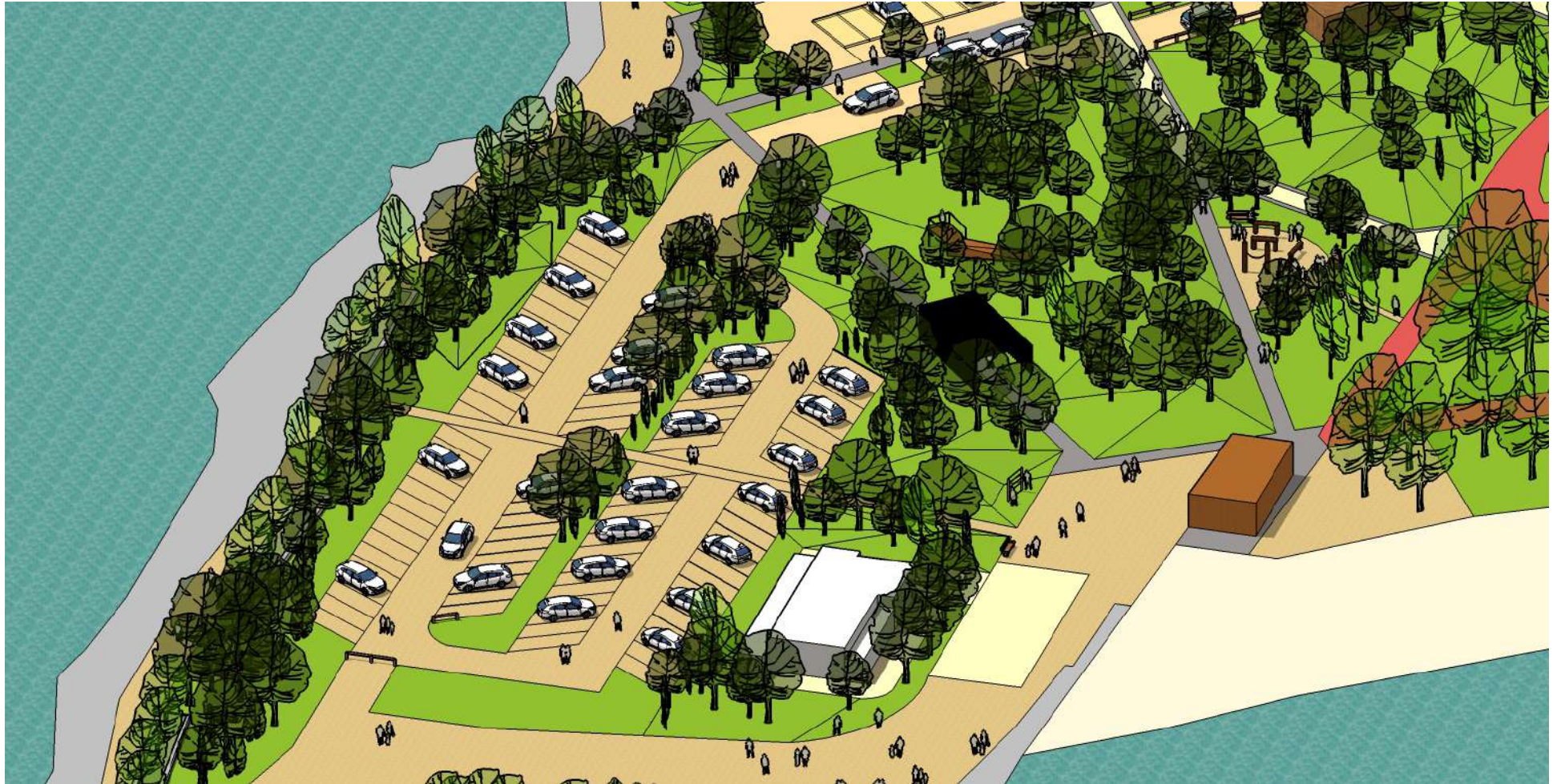
Axonométrie partie est parking