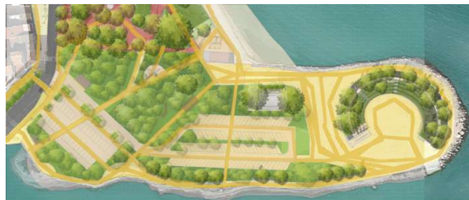
Des cheminements piétons sécurisés et lisibles