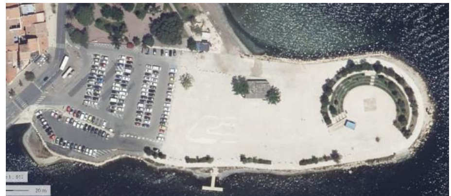
photographie aérienne de l'état actuel