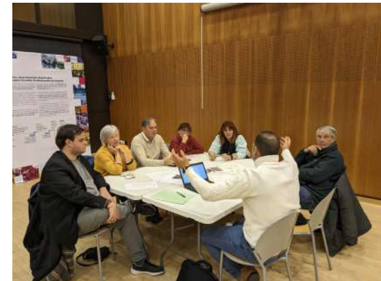
photographies des ateliers