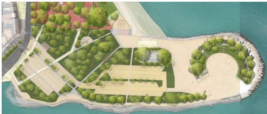
6 000 m 2 de jardin en pleine terre