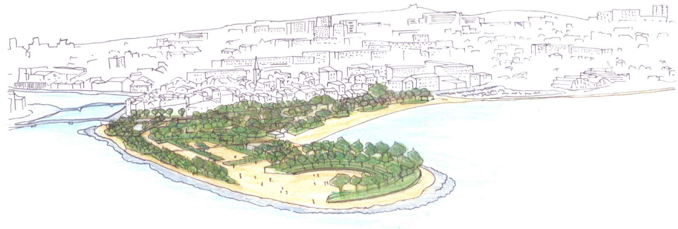
Axonométrie du projet