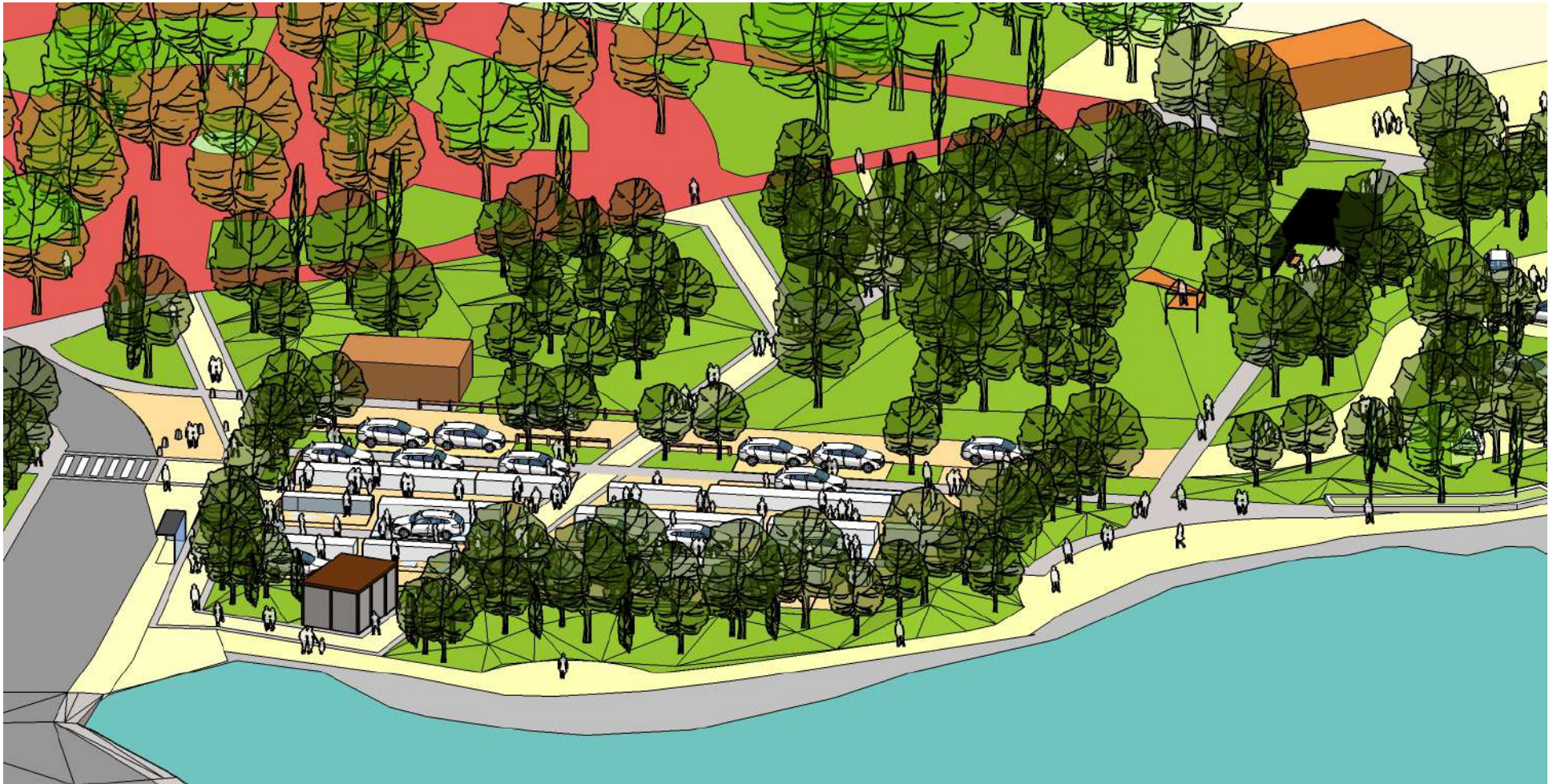
Axonométrie partie ouest version marché