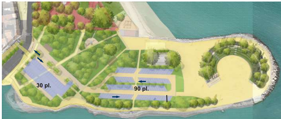
Un parc de stationnement 30 + 90 places