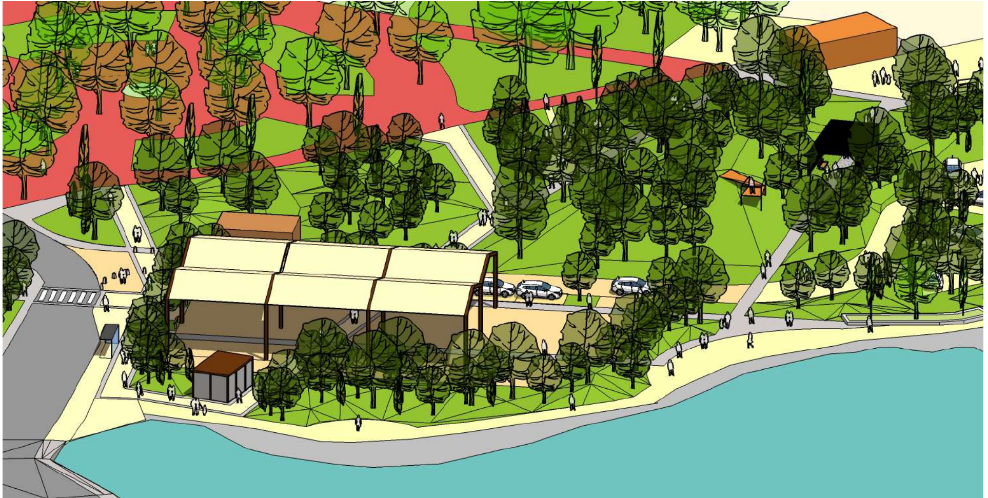
Axonométrie partie ouest version halle couverte hors budget