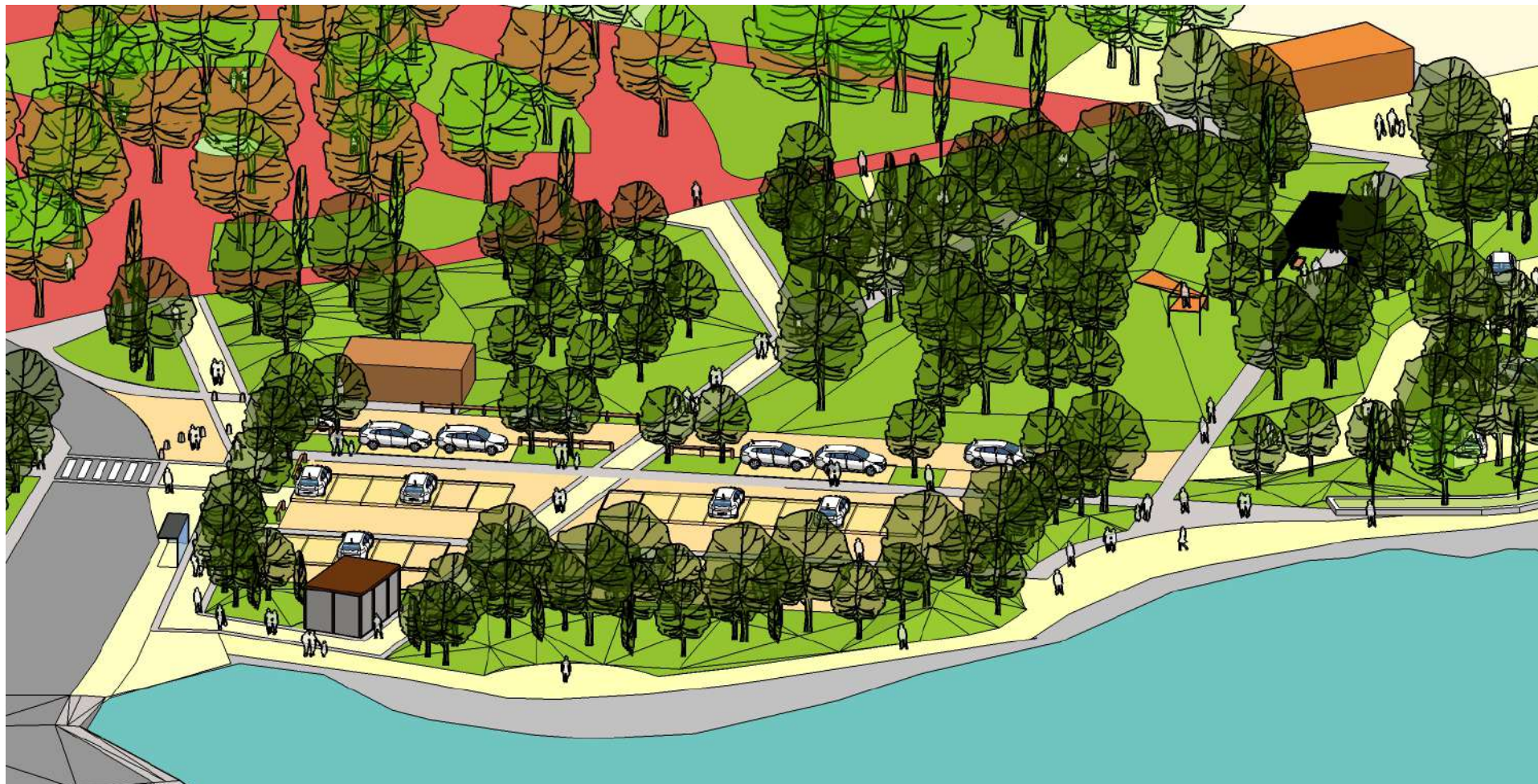
Axonométrie partie ouest version stationnement