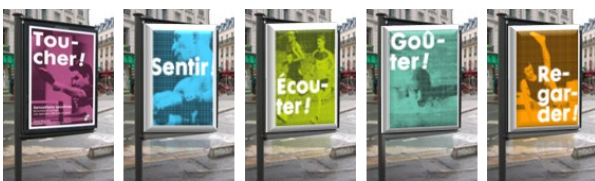
Exemple de mobilier urbain dans la ville

L'originalité de cette exposition « Sensations sportives » permettra de faire partager et découvrir à tous publics, une approche différente du sport autour des cinq sens pour voir, entendre, sentir, toucher et goûter.